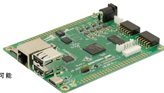
AP-RZFV-0A の外観 基板寸法:100x80mm (コネクタ、突起物除く)